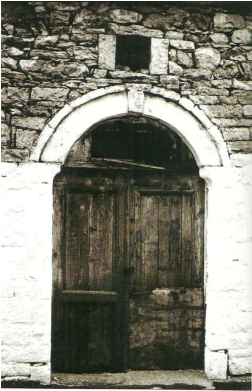
Είσοδος της οικίας Τσανάκα.