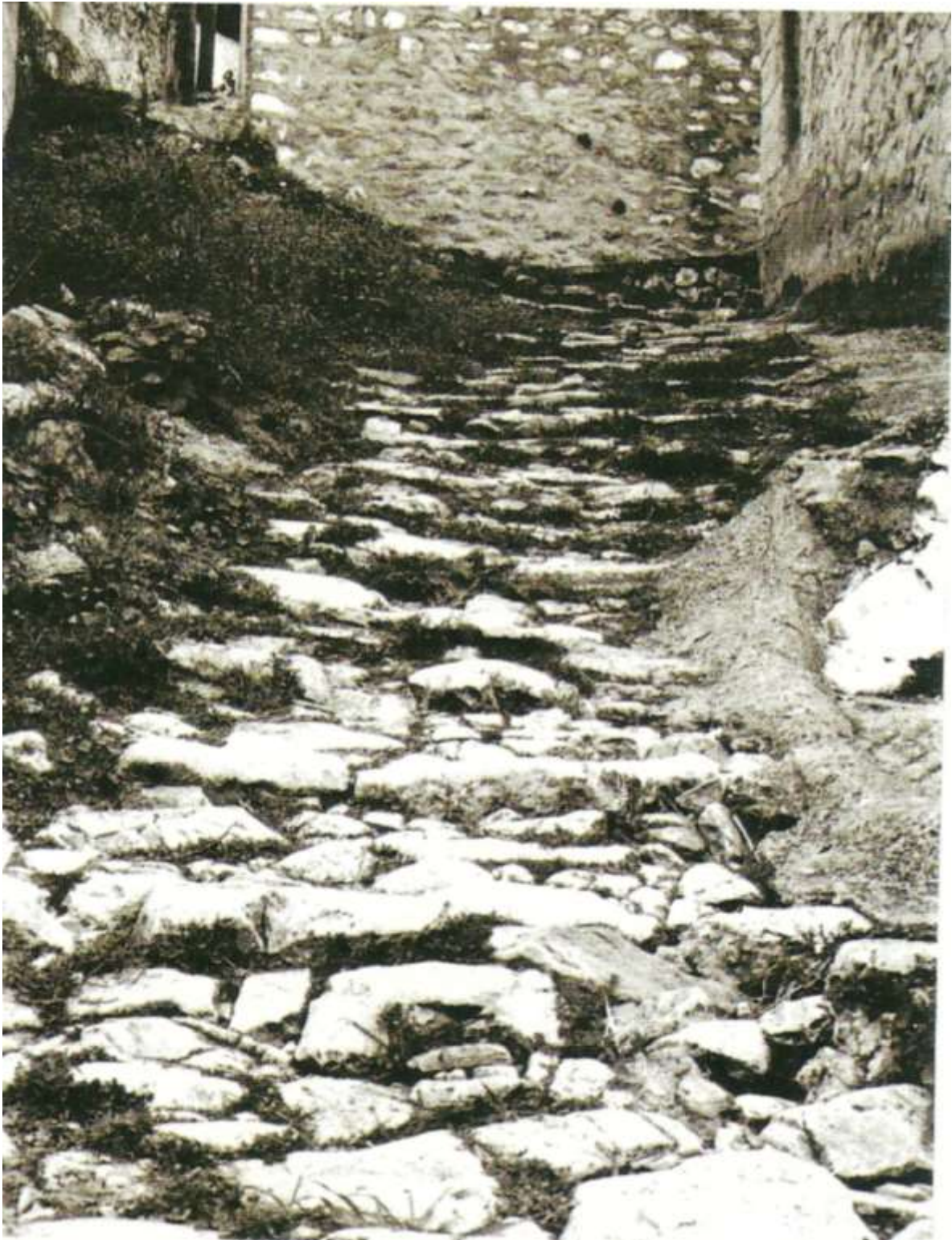
Καλντερίμι, από τα λίγα που σώθηκαν.