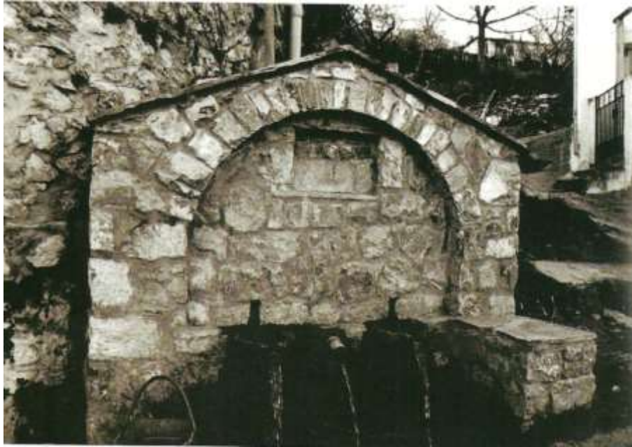
Η Χρούσου, στο νοτιοδυτικό άκρο του χωριού.