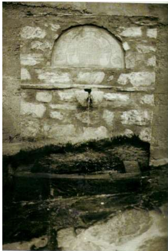
Η βρύση Χρυσσοχόου Fountain of Chrysochos