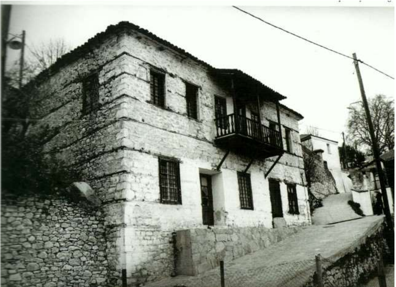
Χαρακτηριστική Ραψανιώτικη αρχιτεκτονική