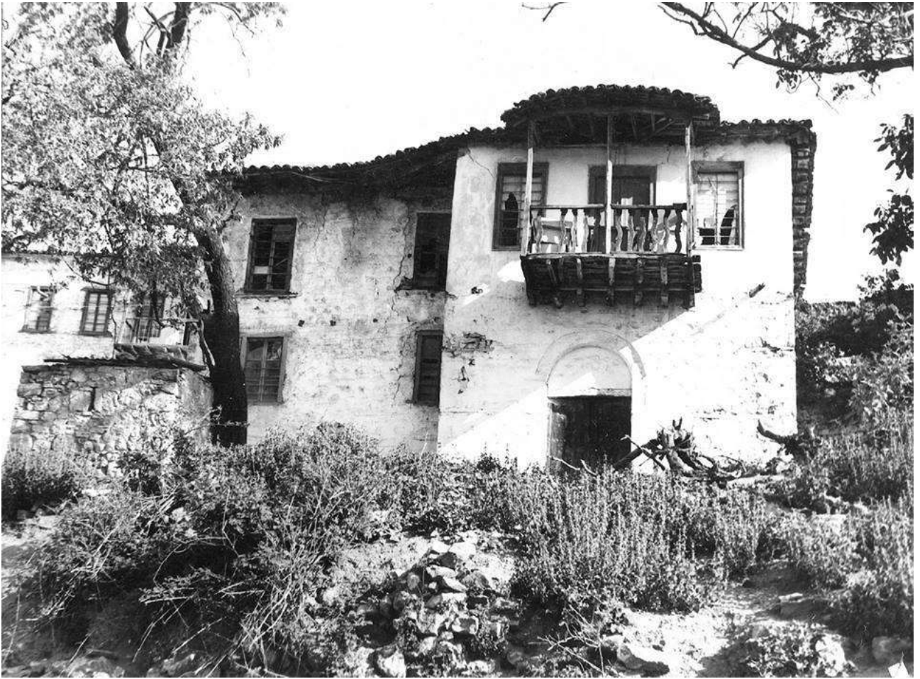
Ραψάνη 1930, αρχείο Κ.Στουρνάρα.