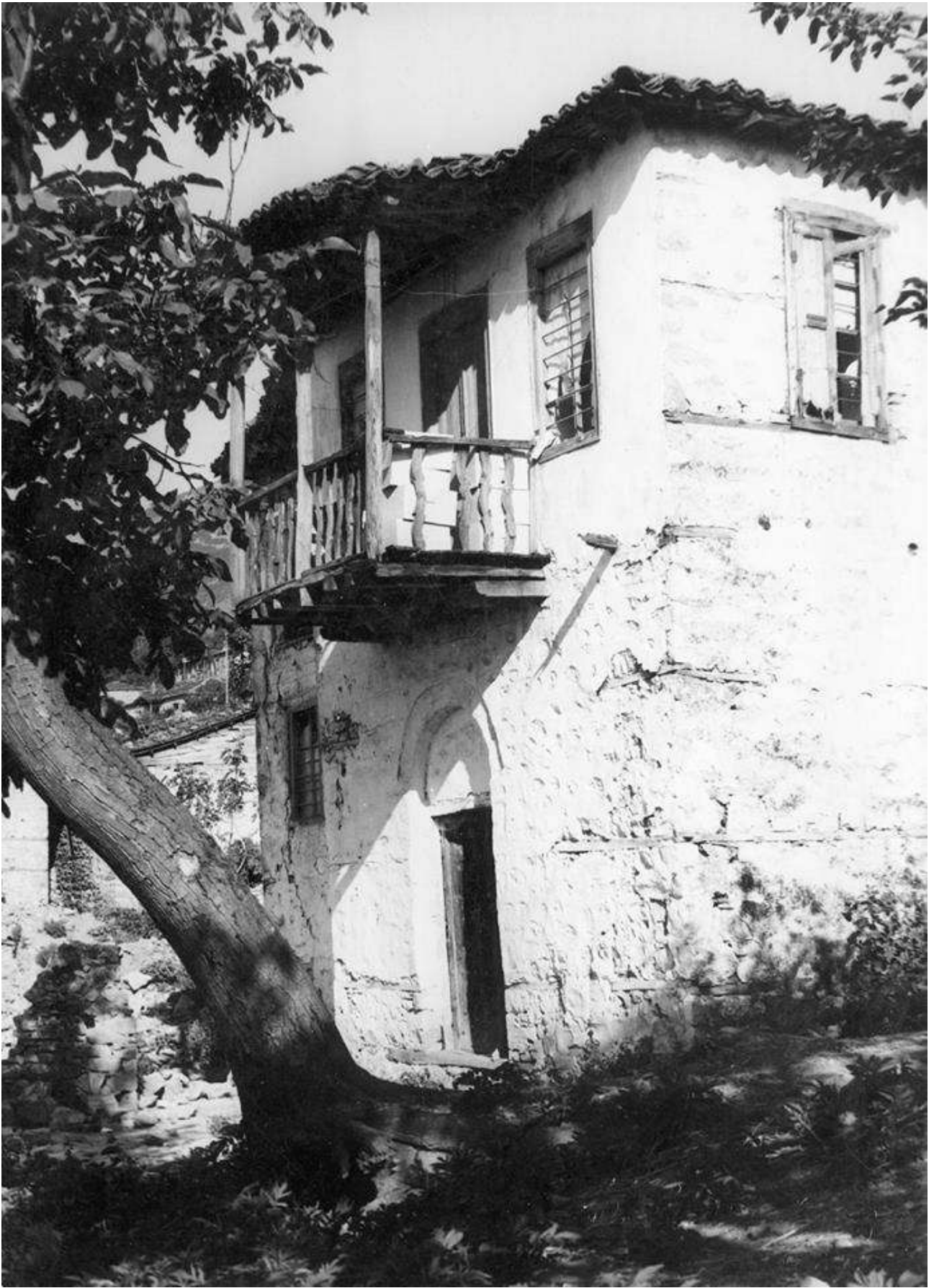
Ραψάνη 1930, αρχείο Κ.Στουρνάρα.