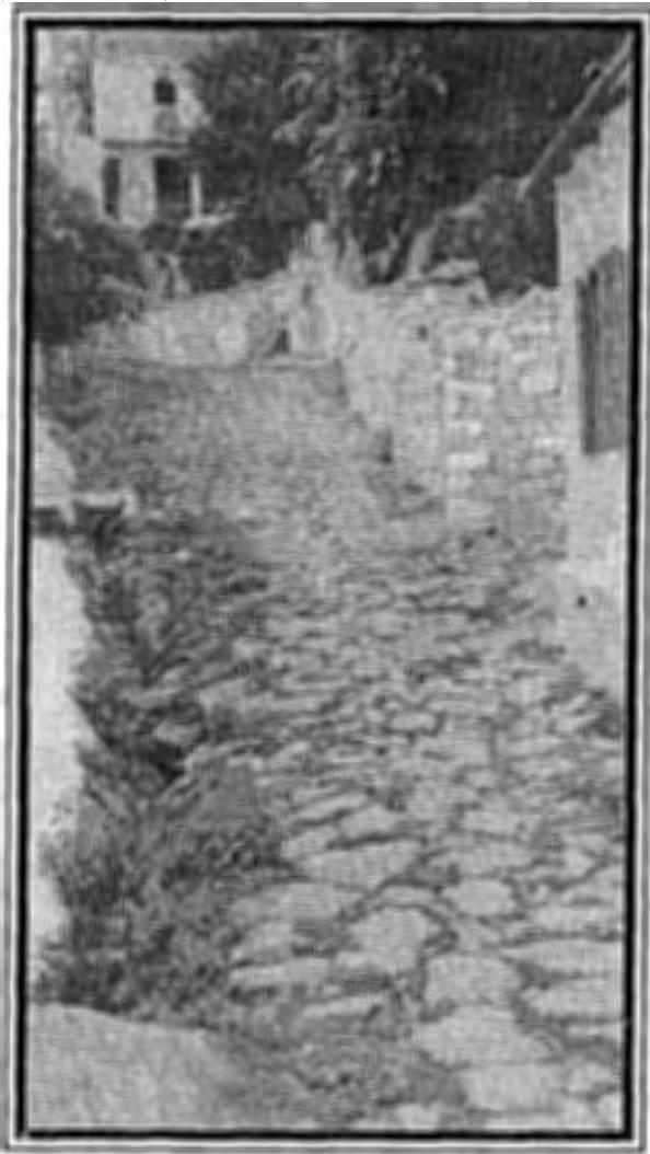
Καλντερίμι προς τον Άγιο Αθανάσιο.

Όσον αφορά τα παραδοσιακά καλντερίμια, που κινδυνεύουν να τσιμεντοστρωθούν, αναγκαίο είναι να γίνει διατήρηση σε ένα κομμάτι του κέντρου του οικισμού σαν χώρος μνήμης και περιπάτου που να συνδέει τους δυο ναούς.