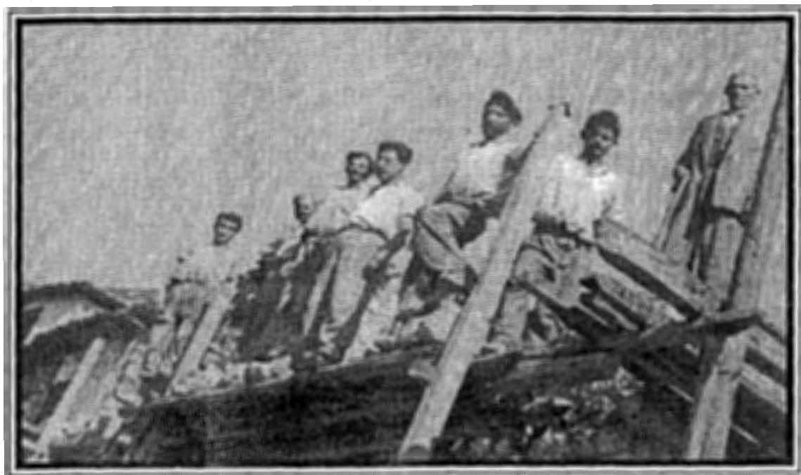
Οι «Μαστροβαγγελάδες» στη διάρκεια χτισίματος σπιτιού. (φωτογραφικό αρχείο του Βαγγελη Νίκου).

χρήση λάσπης ή στην καλύτερη περίπτωση ασβέστης. Πλιθιά στη Ραψάνη δεν συναντούμε.