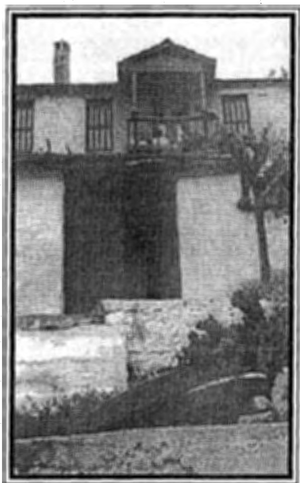
Οικία Αναστασίου Μαχά.

Οι δρόμοι που παλιότερα ήταν με πέτρα στρωμένοι (καλντερίμι) τώρα έχουν οι περισσότεροι γίνει τσιμεντένιοι. Παλιότερα τα νερά έτρεχαν μέσα στον οικισμό σε ειδικό αυλάκι και μάλιστα με τα νερά αυτά κινούνταν ο νερόμυλος πλάι στην εκκλησία του Αγίου Αθανασίου. Από αυτό το μύλο σήμερα μόνο οι δυο μυλόπετρες - σώζονται (ιδέ φωτό).