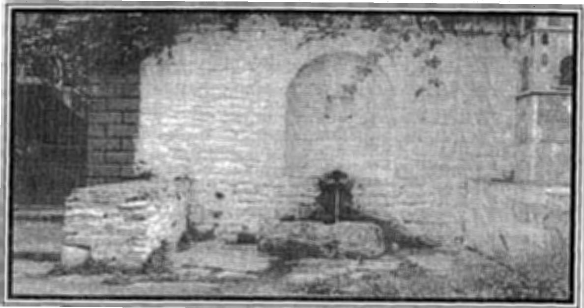
Βρύση στην πλατεία της Ιτιάς.

τη Ραψάνη, όπου διασώζει ένα τετράδιο μάστορα ξυλουργού).