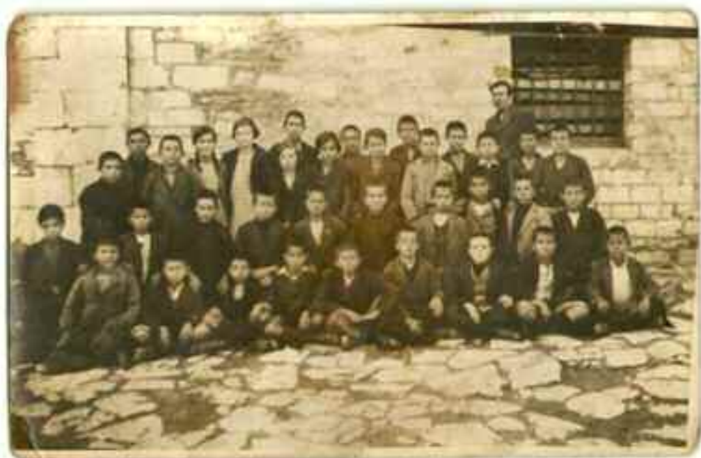
Αναμνηστική φωτογραφία μαθητών της Μανιαρείου Σχολής. Κάτω, η πίσω όψη της φωτογραφίας.